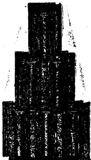
Product din Chichinda-mare Țigle licențiate de siguranță fabrica Bohn, Nr. 272.

Preț-curant și mostre trimitem, la cerere, gratis și franco.