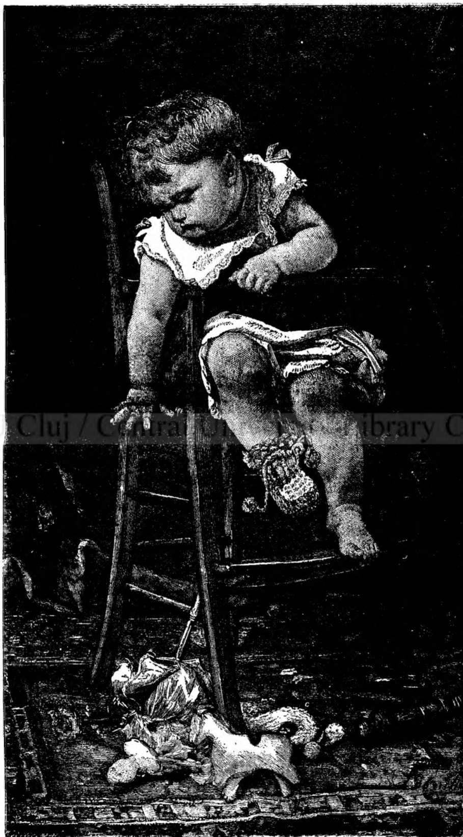
BĂIATUL IN SCAUN.