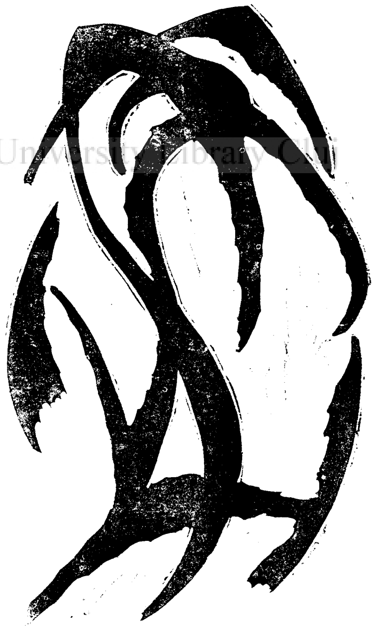
Linoleum de Mattis Teutsch