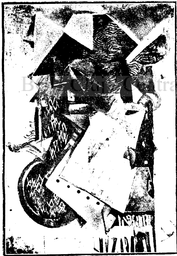
Pictură de Marcel Iancu