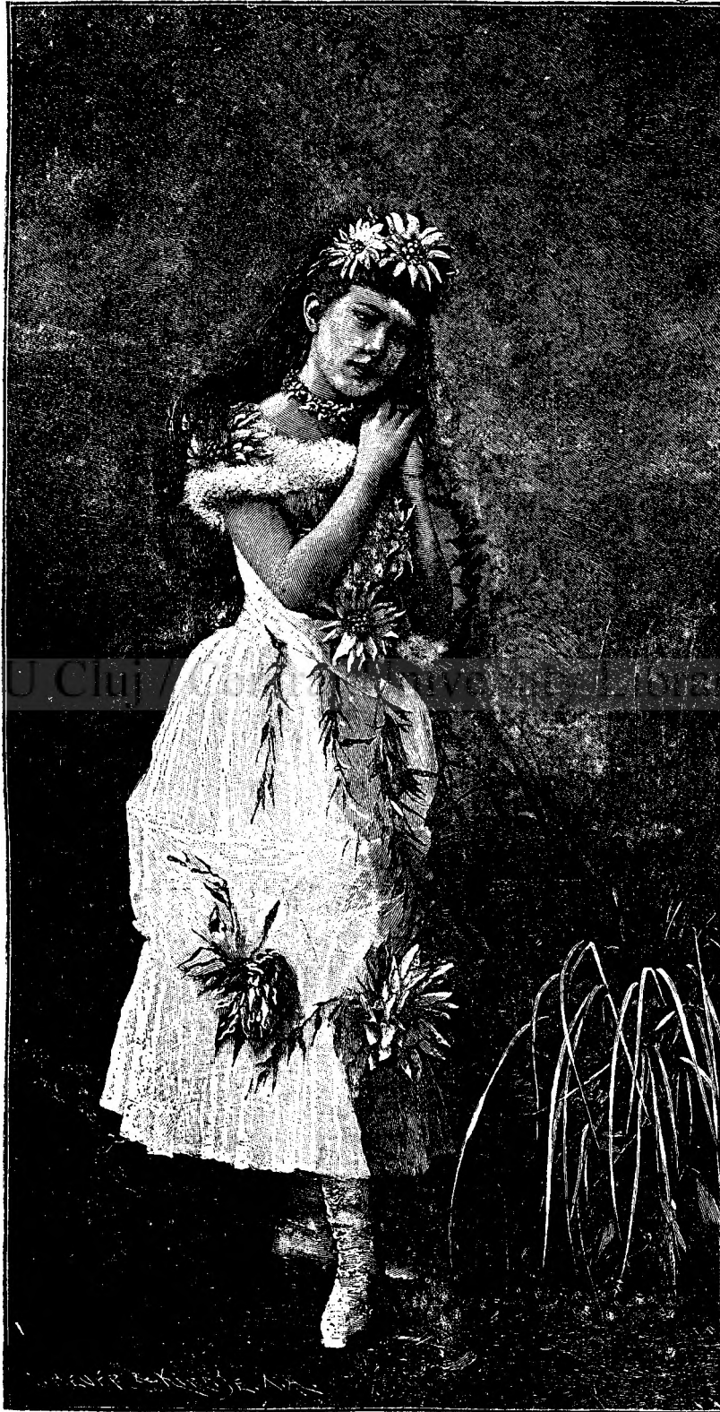
PRINCESA MARIA VALERIA.