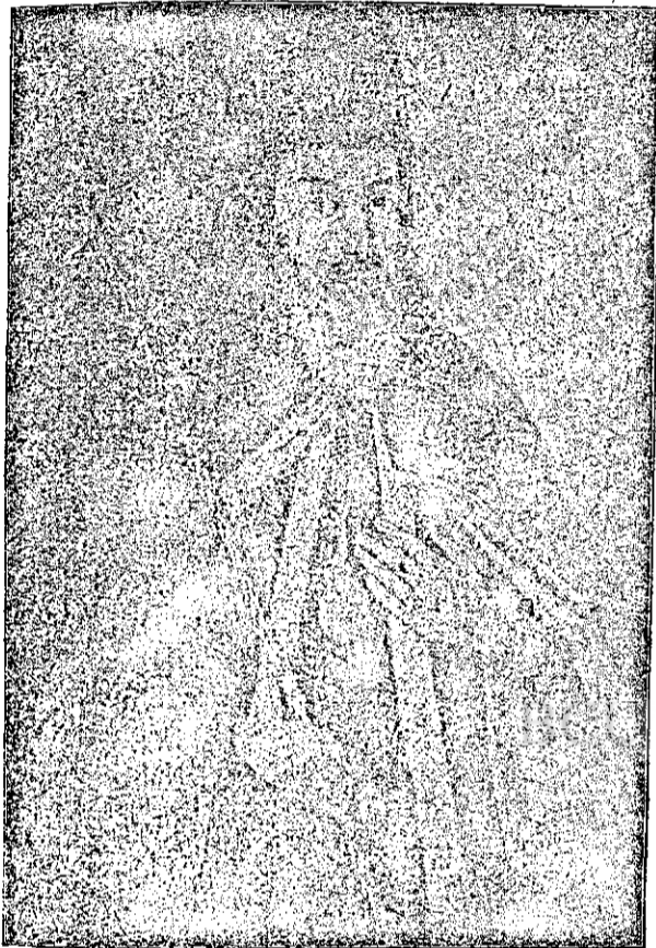
Vlădica Petru Pavel Aron, intemeietorul școlilor din Blaj.

O mulțime mare de popor ne aștepta înaintea bisericii frumoase și mari, cum numai catedrala din Blaj mai este. Dimineața s'a făcut apoi sfințirea bisericii, fiind de față o mulțime mare de țărani și de frunțași din toate părțile Munților Apuseni. La banchet au fost multe cuvântări, însuflețire mare și dragoste multă arătată către înaltpreasfințitul.