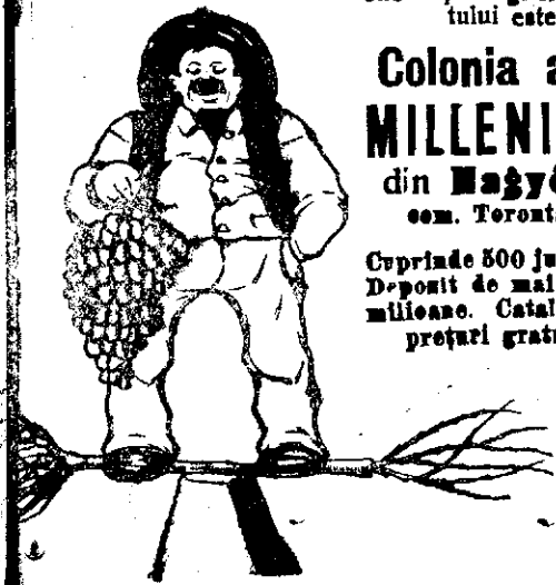
CUMPARARE DELA COL. AGRIC. MILLENIUM.

Cuprinde 500 jug. cat. Depozit de mai multe milioane. Catalog de prețuri gratuit.