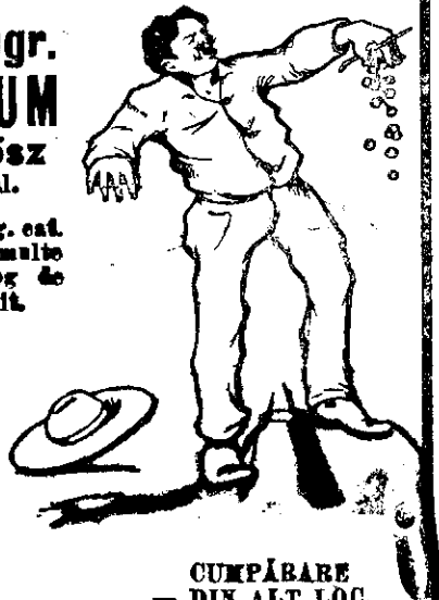
CUMPARARE — DIN ALT LOC.

Mâna fiecăruia poate fi frumoasă dacă o îngrijește destul. Cel mai bun mijloc pentru îngrijirea mânilor este Lichidul „Elza” pentru mâni