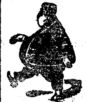
s'a îngrășat de 120 Kigr.

47 Kigr. cântărea di Dr. Ge. a Att'ia din Volo- sánka, care din tubercu- loasă s'a vindecat prin siru- pul de brad Castillio și de siruful Hypophosphat