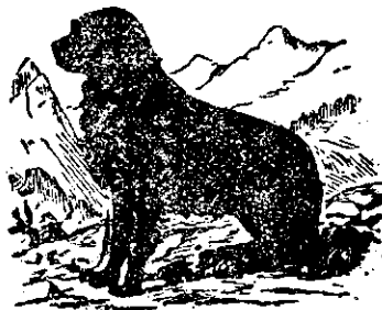
La „Cănele negru“.