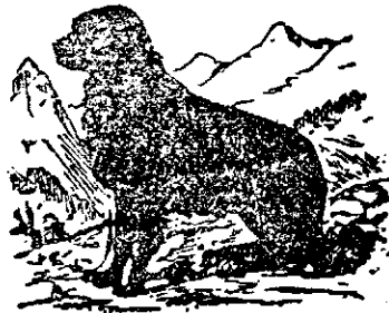
La „Cănele negru“.