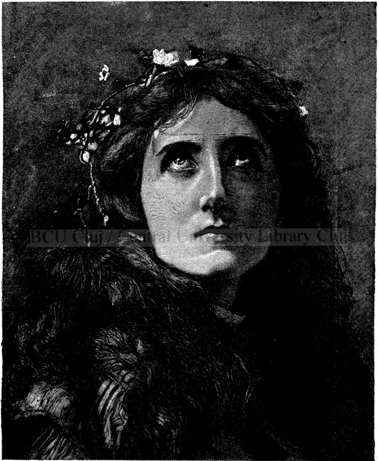
D o l o r o s a