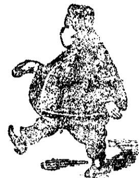
s'a Ingrășat de 120 Klgr.