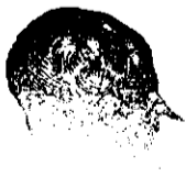
După folo înță.

Nu mai este boală de porci dacă vei comanda vestitul praf de nutreț din Seghedin.