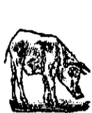
Medie de folosință.