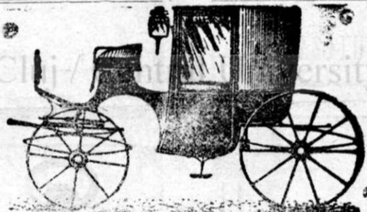
Nrul telef. 439.

In mai multe expoziții premiat cu primele premii.