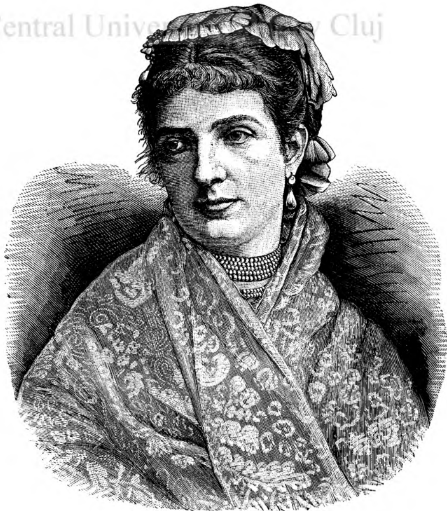
Margareta regina Italiei.