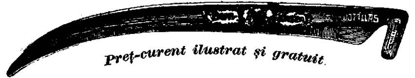
Preț-curent ilustrat și gratuit.

Coasa de oțel „Bur“ numai atunci este veritabilă, dacă pe mâner poartă gravată inscripția aceasta: W. G. Kőbánya , iar pe latul ei este tipărită marca firmei cum arată figura asta: 190 2—20