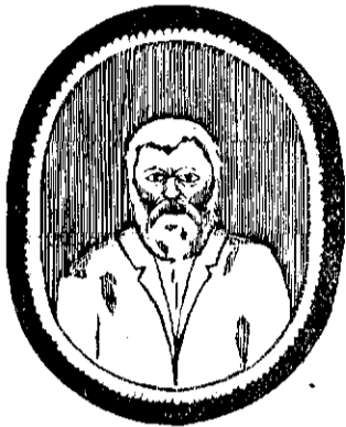
Ioan Jurca de Călinești

a fost descendent al familiei nobile Jurca de Călinești jud. Maramureș. Teodor Jurca în anul 1514 a fost conducătorul poporului în răscoala lui Doja, luptând contra iobăgiei. În 1725 Grigore Jurca a fost primpretor, Timoteu Jurca jurisconsult județan; Paul Jurca locotenent.