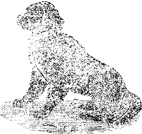
LA CÂNELE NEGRU.

Deserturi (delicatese) și de coloniale tropice.