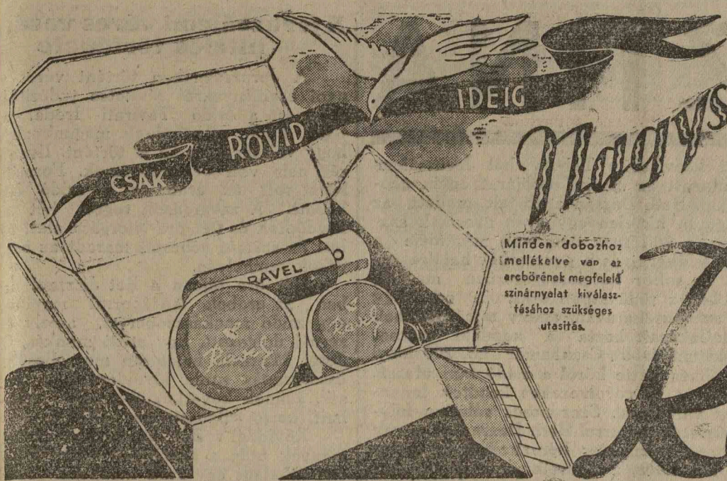
Minden dobozhoz mellékelve van az arcborének megfelelő színárnyalat kiválasztásához szükséges utasítás.

Ha egy doboz RAVEL pudert, arc-festéket vagy ajak-rouget vásárol, minden dobozban meg fogja találni a másik két gyártmány egy-egy mintáját, melyek meggyőzik Önt a gyártmányok kiválóságáról