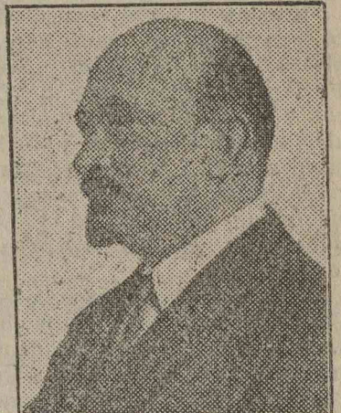
Dr. Chaim Weizman

Zsidó körökben meg vannak győződve arról, hogy Weizman tárgyalásai szoros kapcsolatban vannak, a palesztinai királyi bizottság befejezett munkájával és a francia kormány támogatását kérte, a cionista politika számára. Különösen jelenős ez, a mai körülmények között, amikor Londonban fogják eldönteni Palesztina jövőjét és az egész zsidó immigráció problémáját hosszú időre megoldják. Most, hogy az alexandretti szandzsák ügyében a francia és török kormányok végleg megegyeztek, remélni lehet, hogy a Syria kérdésében elfogulatlaná váli Franciaország, támogatni fogja a zsidók igényét, annál is inkább, mert a lengyel zsidóság helyzete is megköveteli, hogy ki vándorlási területek szerzésében a francia kormány támogassa a világ zsidóságát. Léon Blum örök hálára kötelezheti a világ zsidóságát, ha támogatni fogja, francia presztízzsel és befolyással, a bevándorlás kérdésben, úgy a palesztinai zsidóságot, mint a Jewish Agencyt és azokat a zsidó milliókat, akik ott új hazát keresnek.