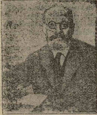
Dr. Osias Thon

Krakko Dr. Osias Thon, a világszerile ismert és becsült lengyel zsidó vezér, óriási részvét mellett temették el. A város zsidó negyedében valamennyi zsidóüzenet zárva volt. Már a kora reggeli órákban óriási tömeg hullámzott az utcákon, hogy ideje-