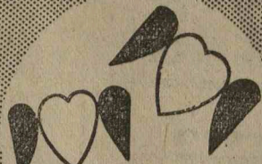
Kinyílnak a szívek