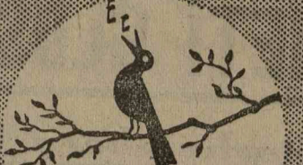
Megjött a tavasz

Most igazán NIVEA-val a levegőre és napra.