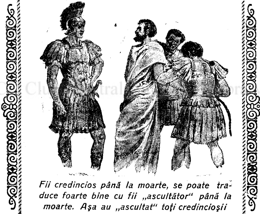
Fii credincios până la moarte, se poate traduce foarte bine cu fii „ascultător” până la moarte. Așa au „ascultat” toți credincioșii de totdeauna.

Ascultare, ascultare de cuvântul lui Dumnezeu! Iată ce ne poate scăpa de orice duh de rătăcire și de orice abatere din calea Domnului. Să luăm pildă de ascultare dela Domnul Isus care s'a făcut ascultător până la moarte și încă moarte de cruce (F lipeni 2,8). Când vin ispitele și oamenii vor căuta să ne smulgă din această „ascultare” să le spunem fără înconjur, la o parte, căci trebuie să ascultăm mai mult de Dumnezeu decât de oameni. (Faptele Ap. 5,29).