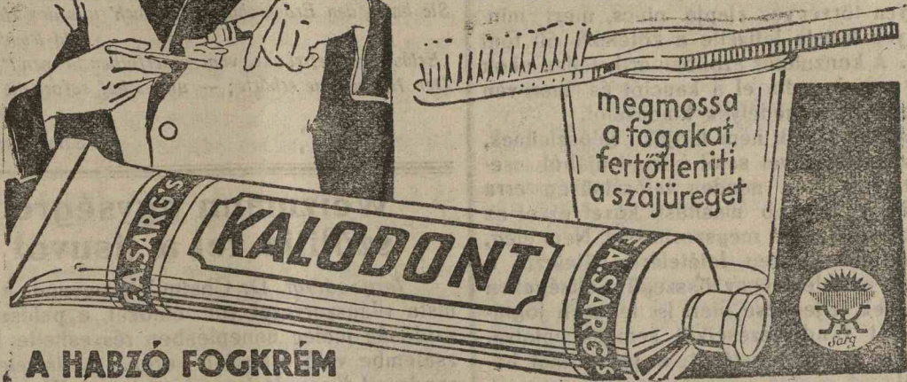
A HABZÓ FOGKRÉM