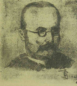
TISZA ISTVÁN GRÓF.

Ezt a szörnyűséget gróf Tisza István nem erte meg. A gesztí sírholt esendjében beken pihent már akkor orlyóvécekkel átfúrt szíve. Ma meg, vagy talán ma már nem lehet tudni, hogy miként fordult a háború utáni magyar történelem sorsa, ha gróf Tisza István életben marad, ha az utolsó pillanataiban acélos kezébe ragadja a gyáván elhajított gyepöl, a rendőrség fogagaban lévő Kun Bélától, akkor utoléri a hozzá egyedül méltó sors: elismerik örökre, hogy e kisebb bajjal elhárítják a később rákzúduló sokkal nagyobb bajt. Me, amikor hála Istónek, jelentékenyen túl vagyunk a világbolsevizmus közvelen veszedelmén, ezt a kérdést nem is időszerű fesszegetni. Ezt elvégti majd a történelem, mely hísségesen számolt fog adni karok eseményeiről, epekek eslekedéséről egyaránt. Mindazonáltal nem celtalan nekünk november havában megemlékezni egyfelől a hirtedt ösírözés forradalom vértanúiról, másfelől a forradalom iszonyatúiról. A vértanúkra emlékezés megerősít meg nem alkuvó erkölcsi erőt ad a nagy veszedelmek órájában minden igaz magyarnak. A forradalom iszonyata pedig, mely szörnyes ár módjárán hőmplyözve, kímélet nélkül borít el és sodor magával mindent, arra tanít minket, hogy minden örökkel, akaratunkkal, lelkesesünkkel, testi lelki, szellemi erőfeszítésünkkel az álltan és a társadalom rendjének fenntartásáért dolgozzunk. A zavar, a bizonytalanság a feloldulást tereltesz. Kiver nyugalmunkból, kiöz hazánkából, áveszi kegyerünkét, mezuromunkból életünkét. A reud, a biztonság megnyug