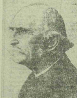
A magyar fölött legjobban az olfók magyar képviselői. A nyugodtság és komolyság, mely ezek a székely magyaroknak az arcáról leszáradnak, meggyőzték az arcon azt a választásért méltóságot is, mely a magyarai a kisebb kultúrájú népek főnökébe helyezi.

Montenegro független állam lesz. A Balkán újjárendezésével létre tartad a fekete hegyek országa is. Hír szerint Montenegro független államként fog beilleszkedni az új rendbe.