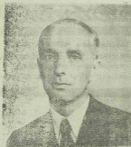
TELEKI BÉLA GRÓF

A Kolozsvári Ősi Betűt Újja alakított termében, ahol az 1848-iki szabadságharc lelkesedésének kimondott Erdélyi unióját Magyarországgal, — május 28-án nagyjelentőségű gyűlésre jött össze Erdély magyar sága, hogy megválassza a párt országos elnökét, és kifejtse az országos programot. A párt országos elnöke gr. Teleki Béla képviselő lett, akit igazí Erdélyisége, népszerűsége, Erdély sajátos érdekeinek meggyőződéses védelme tesz méltóvá az elnöki tisztségre. A mindvégig lelkes bangulatban megtartott gyűlésen a párt országos programját ismertették, amelyet főbb vonásaiban az alábbiakban közlünk.