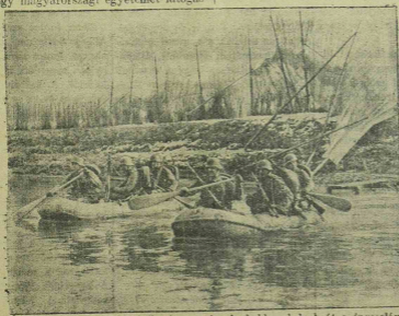
Béla a Vardar-on. Német katonák felfújható gumicsónokban kelnek át a jugoszláviai Vardar folyón.