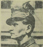
Hátréadások új ellenző sapkája.

Elethelépt a nyári időszámítás. A rendkívüli körülményekre való tekintettel április 7-én éjjel 23 órákor éltbe lépett a nyári időszámítás. Eredetleg úgy tervezték, hogy csak május hónap 9-én fog a nyári időszámítás kezdődni, de tokaréksági okokból már mostan élszerzőnek mutatkozott az időnek egy éval való előrcigatása.