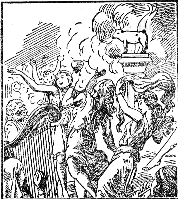
O ceată din cei ce s'au întors „înapoi“. În veselia lor mincinoasă, cred că pot sluji la doi stăpâni. Dar aceasta e calea morții...