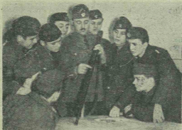
A leventektató a fegyver részeit magyarázza az ifjásnak.

Budavárában az országos leventeparancsnökság