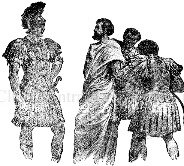
Voi nu v'ați împotrivit încă până 'la sânge în lupta împotriva păcatului! (Evrei 12,4).