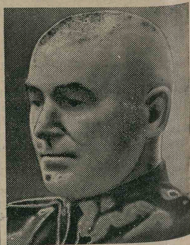
RYDZ SMIGLY, tábornagy.

szok új határokat jelölnek ki Lengyelország számára. A megkisebbedett Lengyelország ugynevezett ütköző állam lenne Németország és Oroszország között. Elcsatolt részein a németek, oroszok és litvánok osztoznának, de arról is lehet hallani, hogy a volt Lengyelország testéből egy kisebb területet kihatárolnának és azon zsidó államot létesítenének. A jelenlegi helyzet szerint mindenestre azzal a szomorú megállapítással kell lezárunk cikkünket, hogy küszöbön áll Lengyelország negyedik felosztása. Lesz-e ebből feladás, vagy pedig a felosztás a lengyel nemzet gyászos pusztulását fogja jelenteni — azt a jövő háborus és diplomáciai eseményei fogják eldönteni. Ezeknek alakulását előre nem lehet látni. Ma még mind a két hadviselő fél kiméletlen harcot hirdet egymás ellen, de az sem lehetetlen, hogy a jobb belátás győzni fog és abbahagyják az ellenségeskedést.