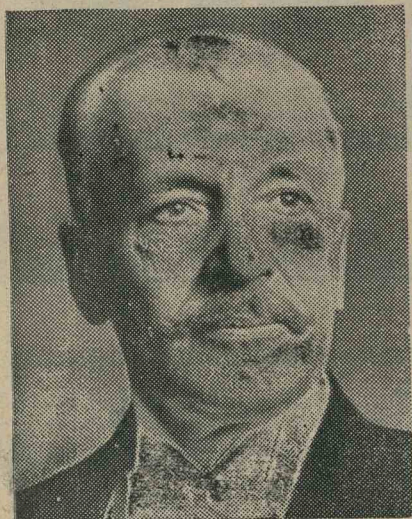
MOSCICKI, köztársasági elnök.

A német és orosz haderő páncélos osztagai legyőzték a lengyel vitézségét. Már a háboru kitörésekor látható volt, hogy a németek fölénybe kerülnek, mert a nyugati hatalmak földrajzi helyzetüknél fogva nem tudják megsegíteni Lengyelországot. — Szomorú dolog, hogy a lengyel nemzet vezetői nem látták ezt előre és szomorú, hogy a háboru kitörése előtt nem találták meg a nehéz helyzetből kivezető utat! Anglia most is hirdeti, hogy a háborut addig folytatja, amíg Lengyelországgal szemben vállalt kötelezettségét teljesíti. Ennek azonban ebben a pillanatban elméleti jelentősége van! A tények ugyanis azt mutatják, hogy a lengyel nemzet gyászos végéért Anglia és azok a lengyel vezetők a jelelősek, akik ott hagyva népüket és a vitéz hadsereget, idegen földre menekültek. Napokig tartott a lengyel menekülteknek Romániába és