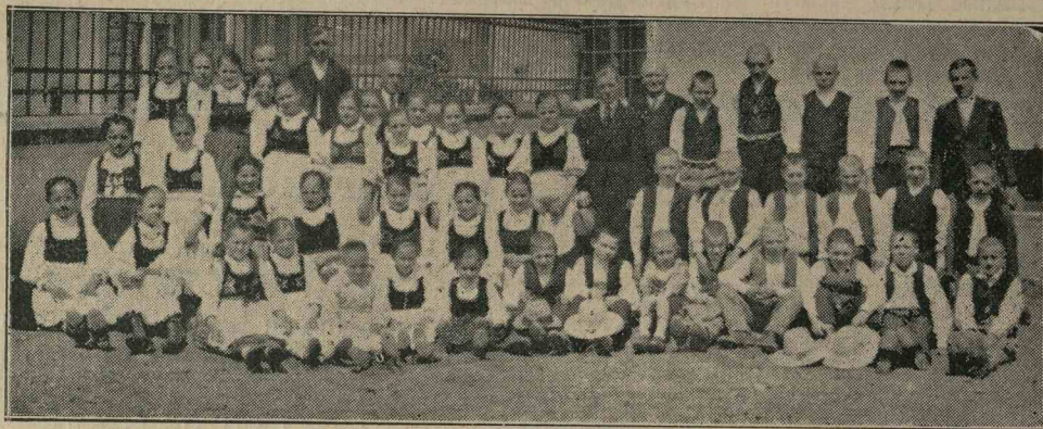
Vágásiak a gyermek-hangversenyen.

Külön öröm látni e megmozdulásokon a szülők nagyfokú érdeklődését. Messze távol-ságokra kísérik gyermekeiket, csakhogy a tör-