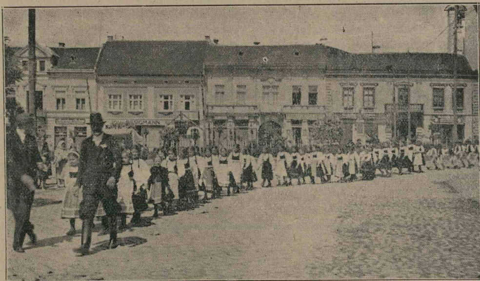
Lövéteik a gyermek-hangversenyen.

mégis a féltő gonddal kiválogatott énekek jó talajba való ültetése jelenti, melyek megfogva a népek nagy életén át, szívósan élnek. A gyermekkórusmozgalom egyedülálló kezdeményezés. Nincs tudomásunk arról, hogy még valahol elemiiskolás gyermekek