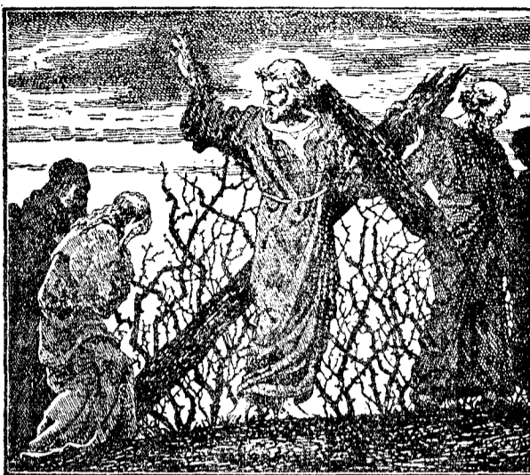
Urmând pe Domnul

a văzut pe doi frați, pe Iacob fiul lui Zebedei și pe Ioan, fratele lui cari erau într-o corabie cu tatăl lor Zebedei și își cârpeau mreșile.