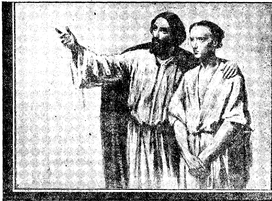
„Doamne, călăuzește-mă“ (Psalm 5. 8.)