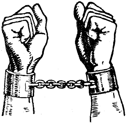
Legat în cătușele... Satane!...

Cum au lăsat „sec” creștinii noștri — Baluri, serate și petreceri pe tot locul — Numai la Cluj, în două seri au fost peste 50 de baluri și serate — în plin babilon. — Mânia lui Dumnezeu se va descoperi din cer împotriva oricărei necinstiri a lui Dumnezeu. — Ce spun Scripturile, sf. Părinți și Canoanele despre jocuri și petreceri.