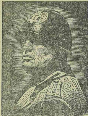
majd Borghese herceg, Róma kormányzója rendezett fogadást tisztelőkre a Kapitóliumon.

Tokióból jelentik: A japán császári főhadiszállás közli, hogy az Egyesült Államok tengeri vesztesége a háboru kitérőse óta 59 elsüllyesztett és 37 megrongált hadihajó. Augusztus 25-ig a japánok 6 csatahajót, 7 repülőgéphordozó hajót, 14 nehéz és könnyű cirkálót, 8 rombolót és 2 különleges rendeltetésű hajót pusztítottak el,