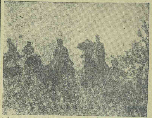
Német hegyi vadászok zsákmányolt, tevéken üldözik az éleltséget a Kuban-folyó vidéken

Elsősorban tehát erre a követelményre kell gondolni.