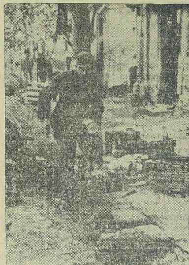
Voronesnél a német katona kiegészíti a municiót