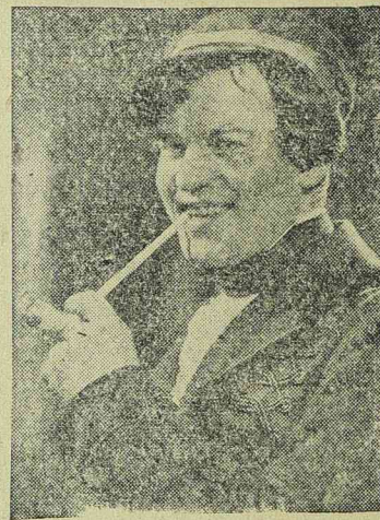
RENÉ DELTGEN az egyik nagyszerű UFA filmben

szik, hogy a film külső felvételei Tirolban készültek és a rendező, hogy a felvételekhez szükséges napfényt rendelkezésre álljon, már reggel hét órakor megkezdte a munkát. A színésznőnek egyik-náisi napon hajnali öt órakor kellett felkelnie, hogy a fodrász és a varrónő a filmezéshez előkészítsék.