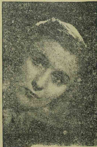
KÄTHE GOLD a Pogány vágyak című Tobis film női főszereplője