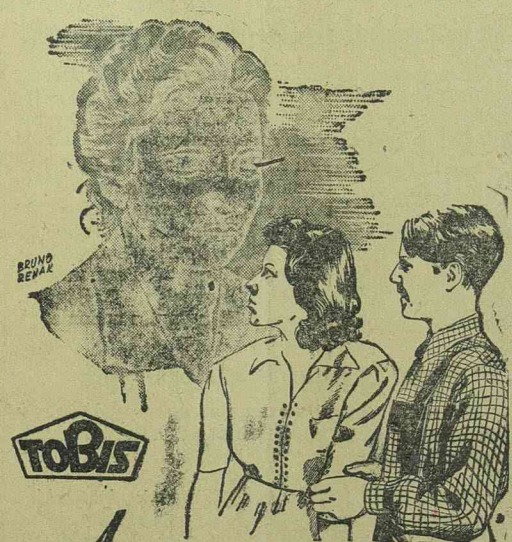
25. sz. hirdató 26. sz. hirdató