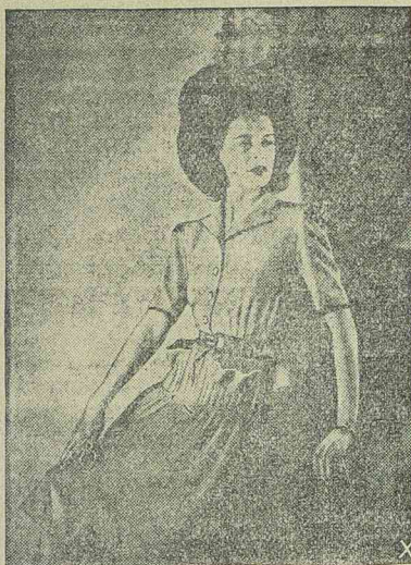
Mustárszíni gyapjuruha bőrvével, előlő zsebekkel és a vállakon fekete himzéssel