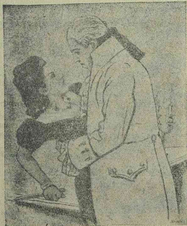
IMPERIO ARGENTINA és MICHEL SIMON a „Tosca” című filmben

— Nehéz jelenet, akármilyen egyszerűnek is lát-szik! Mindig nehéz, ha a felvevőgépnek a színészt kö-vetnie kell! Szerény bólogatással válaszolunk. Tuda-tos tartózkodásunk nyilván jó hatást tesz rá, mert a legközelebbi szünetet egészen nekünk szenteli. Bemut-atkozik, mintha szüksége lenne erre. Mikor megtud-ja, hogy újságírók vagyunk, már tudja, honnan fuj a szél. Készséggel áll rendelkezésünkre. Nem kell két-szer mondani, nyomban a kérdések özönét zudítja rá. Komolyan és olyan megfontoltsággal válaszolgat, mintha minden kérdésnek rejtett értelme lenne. A legtöbb kérdés művészi felfogásának szól. Hogy Willy Birgel vérbeli művész, mindenki tudja. Amire