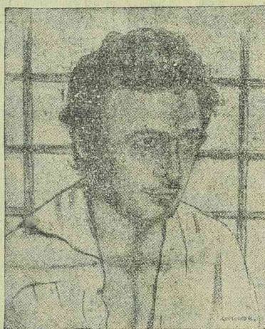
ROSSANO BRAZZI mint Cavaradossi a „Tosca” című operából készült filmben

— Örülök a kérdésnek, véletlenül kitünő példával szolgálhatok. Ott állunk a nagy feltaláló eredeti mo-torja mellett a müncheni muzeum pincéjében. És a vi-lághírű motor, melyhez egy egész élet küzdelmes munkája tapad, egyszerre csak forgásba jön, annyi év után először. A megindítást végző mérnökök az utolsó szegecsig ismerik a gépet, de üzemben még ők sem látták. Elhiszik nekem, hogy ezeknek a „szá-