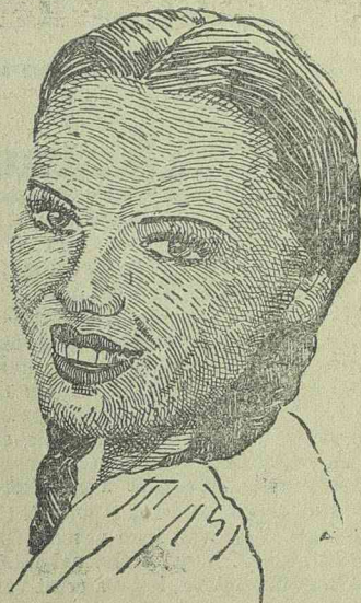
HILDE KRAHL az „Annuska” című Bavaria-filmben

Luxemburgban a német közigazgatás a mozit nagy népszerűsége miatt szert. Ez abból is látszik, hogy a mozilátogatók száma az 1940. évi kimutatással szemben százhusz százalékkal emelkedett. Luxemburgban nem hanyagolják el a tanítási céllal készült kulturális filmeket sem, mert tavaly száz kulturális film került bemutatásra és ezeken az iskolai filmbemutatókon 52.000 tanuló vett részt.