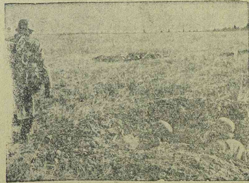
A német telefonosztály katonái az első vonalnál fektetnek le telefonvonalat

Nyomatott a tipografia „Timisoara” környezetében, Timisoara