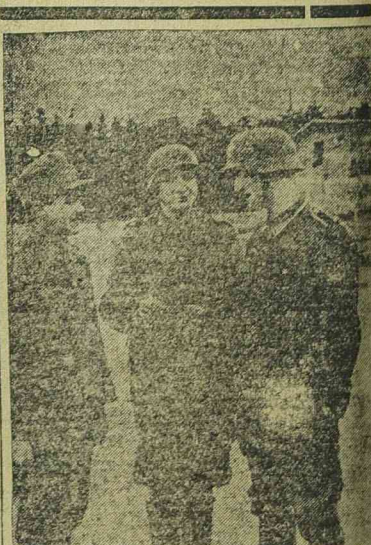
A keleti frontra induló horvát önkénteseket német altisztek okta-ják.