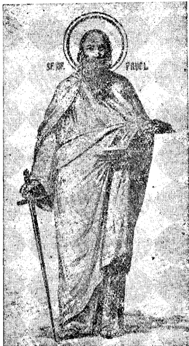
Sf. Apostol Pavel

nevoile sale sufletești. Iar cel ce va mânca această hrană cu vrednicie, va fi viu în veac. Unora ca aceștia