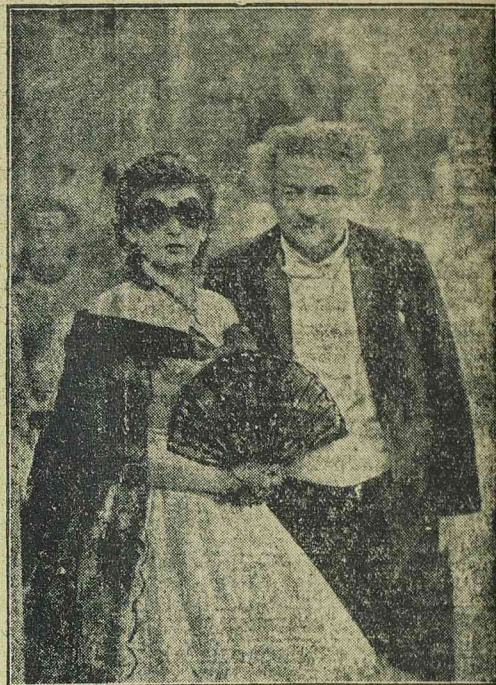
ZARAH LEANDER és LEO SLEZAK a „Mozgalmas bál éjszaka” című UFA-filmben