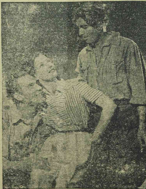
KIRSTEN HEIBERG, VIKTOR STAAL és KARL MARTELL az UFA egyik filmjében