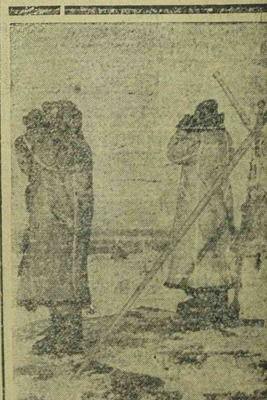
Német légi megfigyelők a riadót jelző haranggal