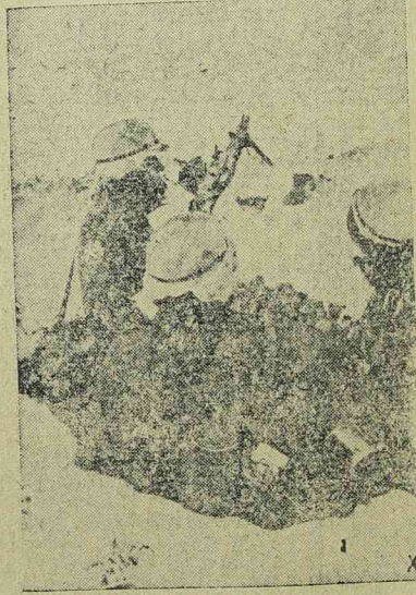
A keleti front, egyik előretolt német állása

Nyomatott a Tipografia „Timisoara” Kom. gépepen, Timisoara