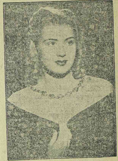
EVA IMMERMANN az UFA-filmek kedvelt színésznője