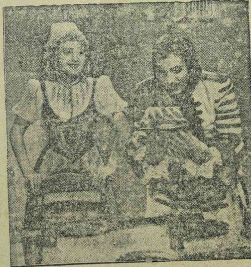
ERNA SACK és JOHANNES HEESTERS a „Nanon” című UFA-film főszereplői