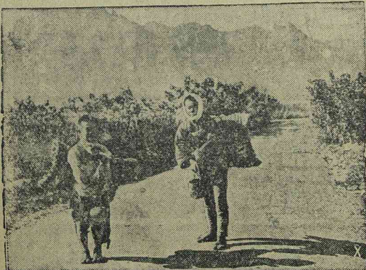
Japán fiúk vándoruton

— Szovjet keresztnevek. Helsinkiből jelentik: A szovjet belügyi népbiztoság 1927-ben bocsátotta nyilvánosságra „A szovjet kormány által jóváhagyott keresztnevek jegyzékét”, Ebben a jegyzékben többek között a következő nevek szerepelnek: (hírnévük részére) Barricado, Radio, Taylor, Desmoulin, Kean, Spinoza, Lincoln, Bakun, Trotz, (Bakurin és Trotszkij után) Nekrass, Kossuchko, Voltaire, Javois, Kolumbus, Grachus, Spartakus stb. (nőnevek részére) Barrikada, Proletaria, Puritza, Ninel, Lunatschara, Akadémia, Amnistitia, Jaurésa és Belbelina. (MN)