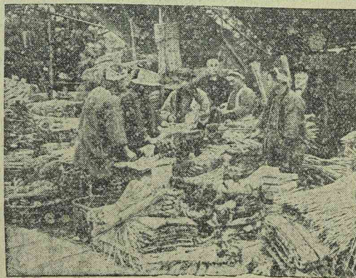
Tokió utcáin ujév napján a bűvös „Shimenawa”-t árufták, amely a japánok hite szerint megvédi a házukat minden bajtól

Eladó alig használt modern gyermekkosci, pénzszekrény, íróasztal, ottomán 1000 kg-os skálamérleg. Timisoara (Temesvár) IV., Fröbl utca 36, II. emelet, ajtó 25. szám. (3416)